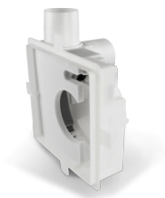
Unterputzgehäuse A80 (Anschluss seitlich oder hinten)