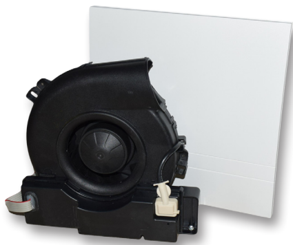
Abluftsystem A80-FS-EC mit Designinnenblende